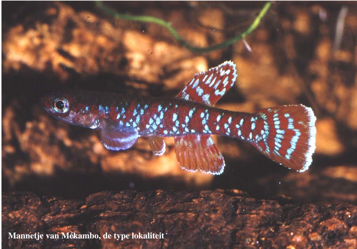
Mannetje van Mékambo, de type lokaliteit